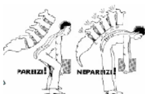
Att. Nr. 1